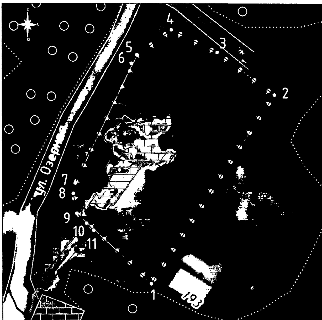
Используемые условные обозначения: