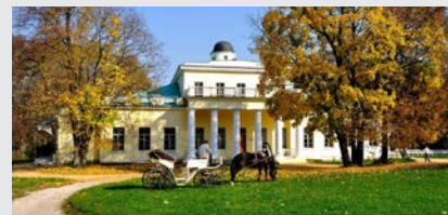
Историко-литературный музей-заповедник Ф.И. Тютчева, с. Овстуг, Жуковский район)